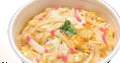
17 玉子丼 630円