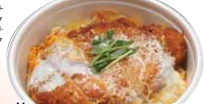
21 かつ丼 930円