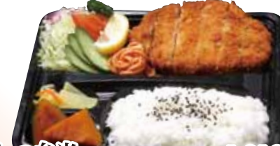
08 とんかつ弁当 1,010円