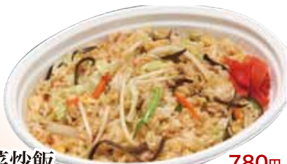
26 野菜炒飯 780円