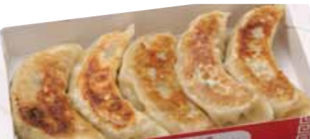
31 強ちゃん餃子(5個入) 630円