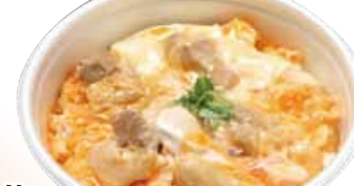
18 親子丼 680円