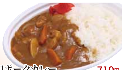
28 昭和ポークカレー 710円