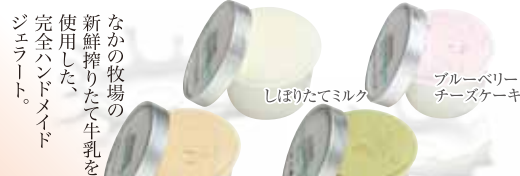
34 なかの牧場ナチュラルジェラート 各種 320円