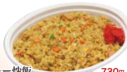
27 カレー炒飯 730円