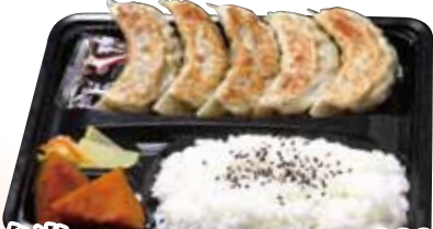
15 餃子弁当 860円