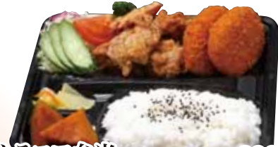
14 ドカカラ Chorizo 弁当 890円