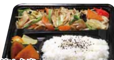
16 野菜炒め弁当 810円