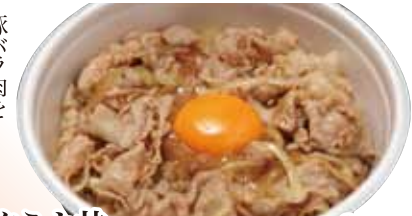
19 スタミナ丼 910円