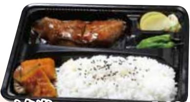
03 銀カレイ弁当 1,000円