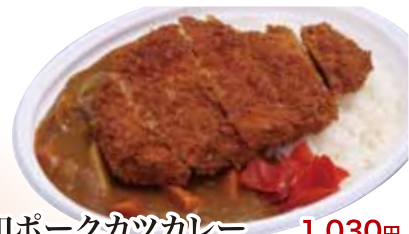
29 昭和ポークカツカレー 1,030円