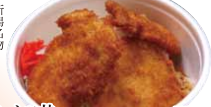
20 タレカツ丼 710円