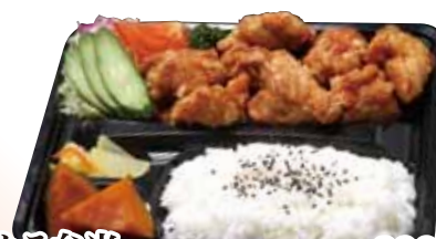
13 ドカカラ弁当 890円