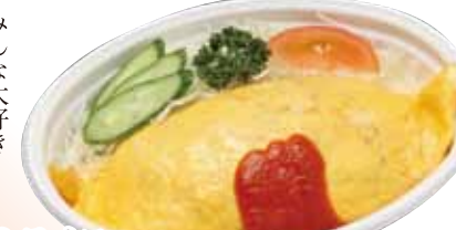
24 オムライス 860円