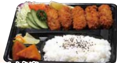
05 カキフライ弁当 1,010円