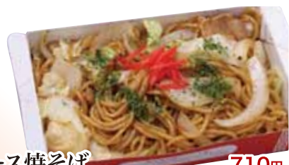
30 ソース焼そば 710円