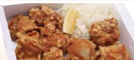
32 ドカカラ 730円