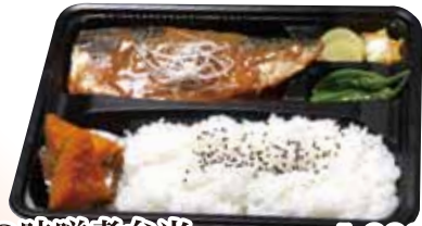
01 さばの味噌煮弁当 1,000円