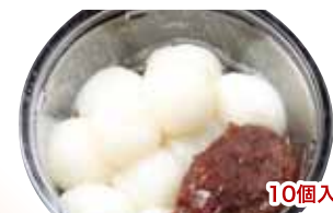
35 特製白玉あずき 10個入 280円 15個入 420円 あずきW(倍増し) 100円

※表記の金額は税込表示となっております。 ※写真はイメージです。盛り付けなど予告なく一部変更になる場合がございます。ご了承ください。