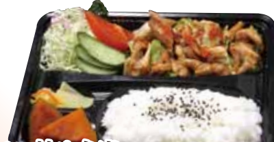
12 ホルモン炒め弁当 890円