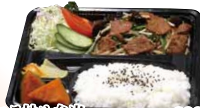
07 レバニラ炒め弁当 890円