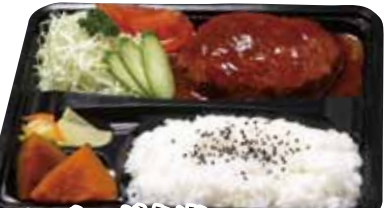
06 煮込ハンバーグ弁当 1,180円