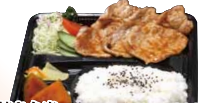
10 生姜焼き弁当 890円