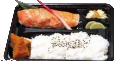
04 銀鮭弁当 890円