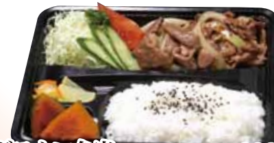
11 ジンギスカン弁当 890円