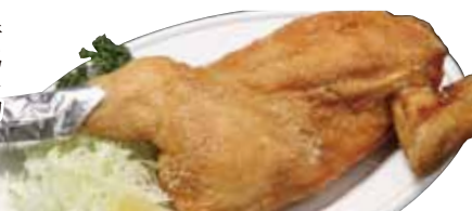
33 若鶏半身揚げ 960円