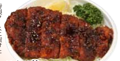
22 ソースカツ丼 930円