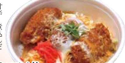
23 カキフライ丼 960円