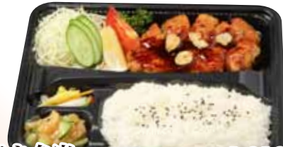
09 トンテキ弁当 1,010円