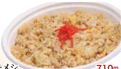
25 ヤキメシ 710円