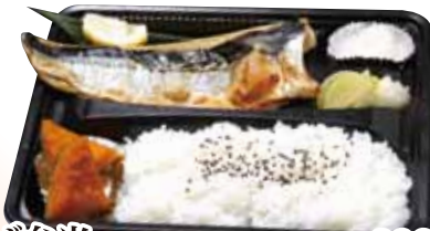
02 塩さば弁当 890円